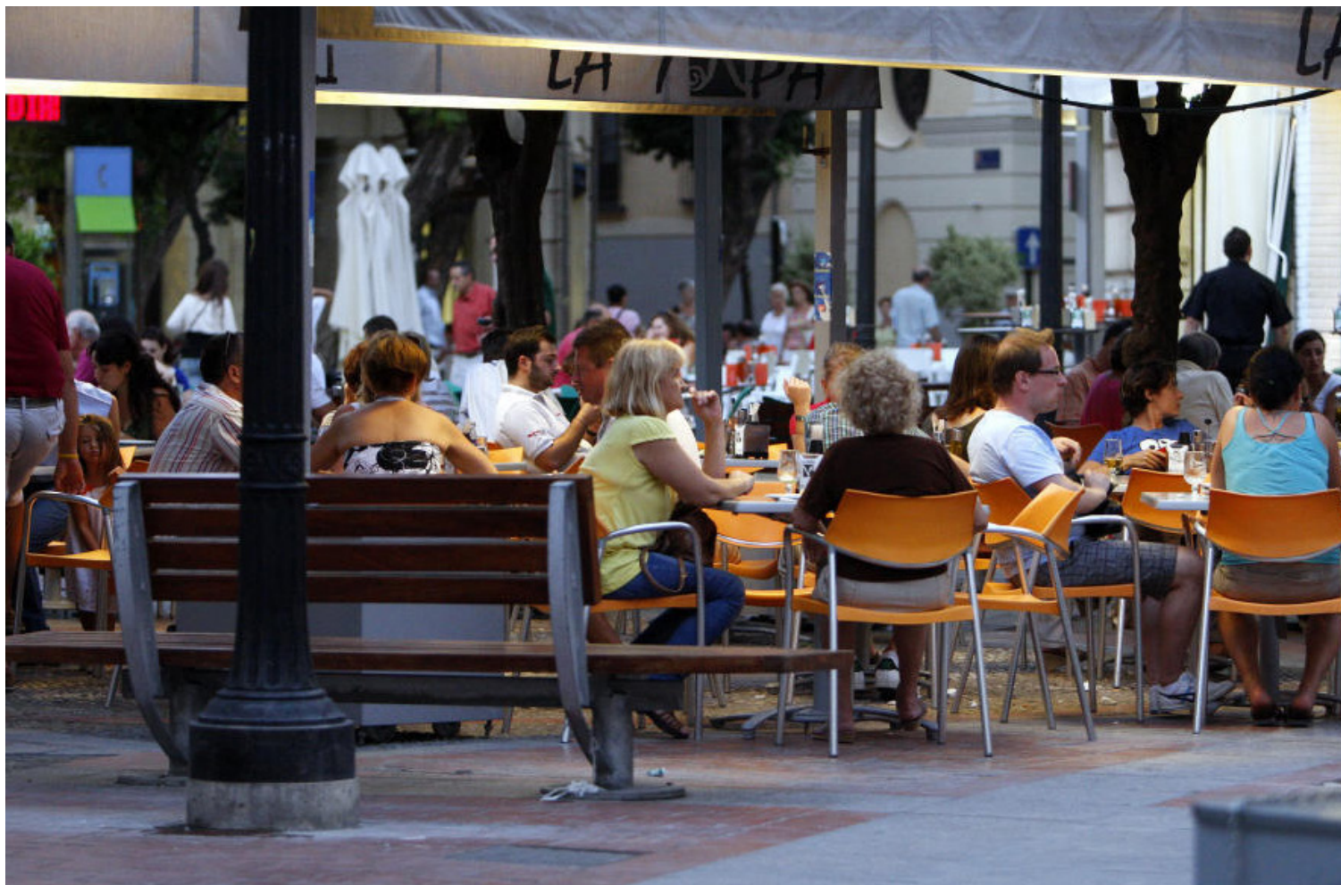
▲ Restaurantes con terraza podrán laborar a partir de hoy, respetando el protocolo de prevención