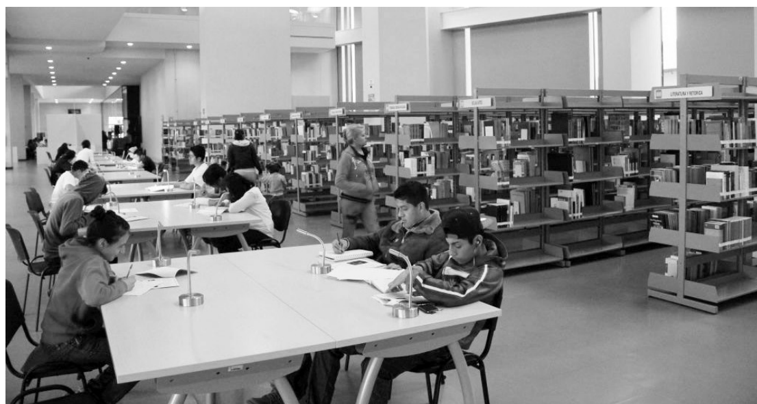
▲ El cupo presencial en la hemeroteca es de 20 personas.

● ● ● La Encuesta Nacional de Lectura efectuada por Conaculta y la UNAM dijo que en 2005 cada mexicano leía 2.9 libros al año