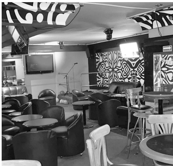
▲ Dueños de centros nocturnos esperan anuncio oficial para abrir.

Asbar dijo que se determinó que cuando se estuviera el semáforo en verde se daría la reactivación pero a ellos no se les ha permitido