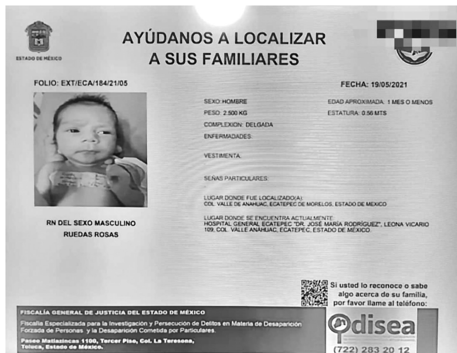
▲ La Fiscalía emitió una ficha de búsqueda para dar con el paradero de los familiares.

Para información de los tres casos, las autoridades cuentan con el número 800 7028770 del Centro de Atención Telefónica de la Fiscalía General de Justicia del Estado de México.