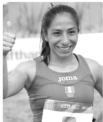
▲ La pentatleta avanza a la final del Mundial.