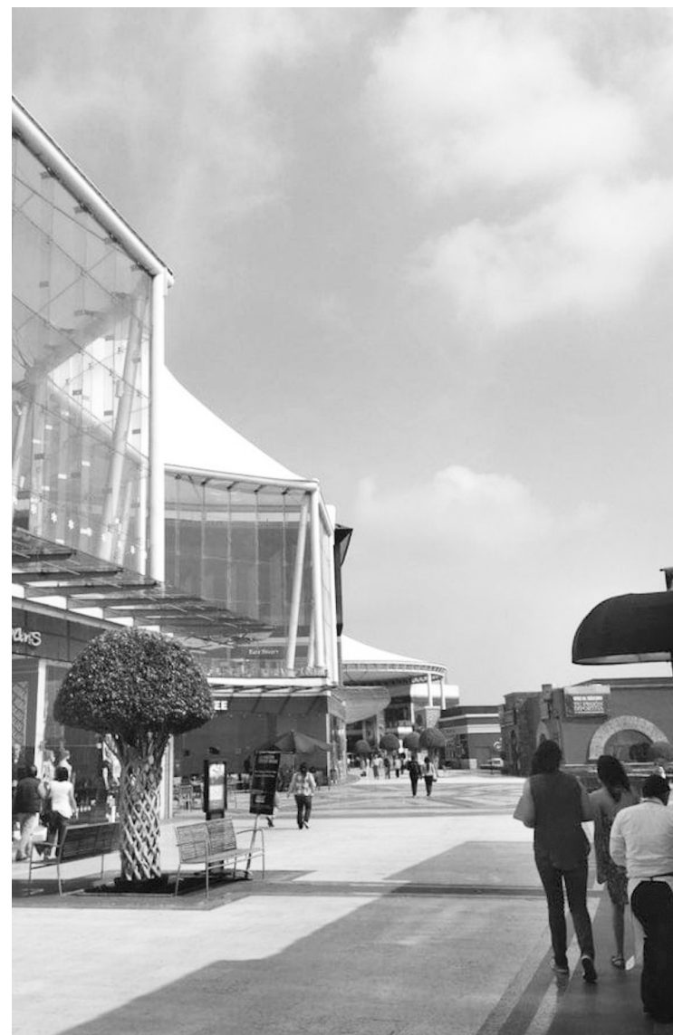
▲ Varias tiendas de La Cúspide permanecen cerradas.

El líder de la Concordia comentó que “si no mejora la economía y se baja el precio de las rentas, esas plazas podrían quedar vacías, como le pasó a Acrópolis”.