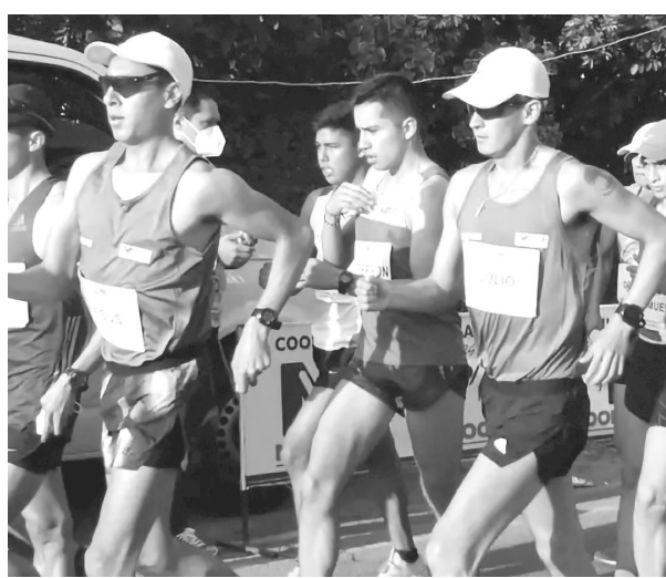
◀ 9 mexiquenses, en la rama varonil, deberán de mostrar de qué están hechos.

La final se disputará hoy, y se espera que la mexiquense se mantenga dentro de los primeros lugares como lo ha hecho a lo largo de la temporada y asegurar así la clasificación.