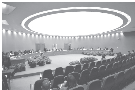
◀ El Consejo General determinará las acciones a seguir.

Con el objetivo de dar el reporte final de los cómputos distritales y municipales, el Consejo General retomará la sesión ininterrumpida.