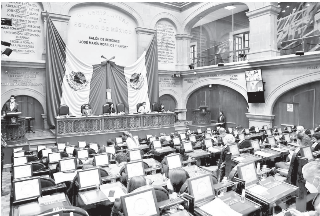
▲ Los diputados son electos cada tres años mediante el voto.