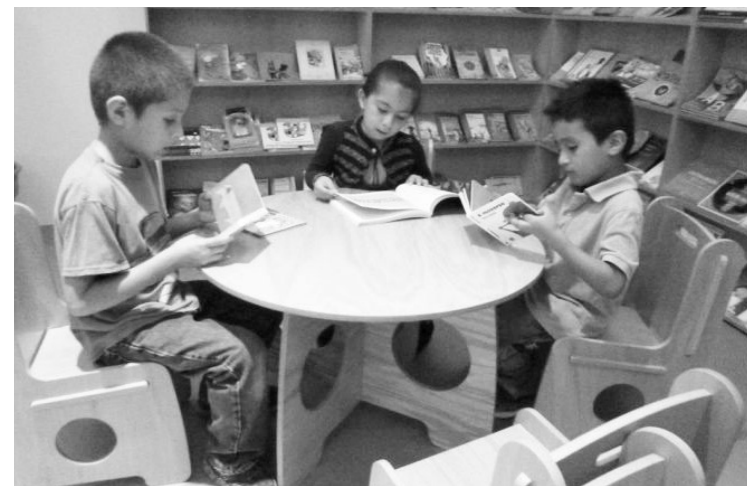
▲ El objetivo es inducir a los jóvenes la pasión por la lectura.

El cupo presencial en la hemeroteca del CCMB será limitado a 20 personas y las inscripciones están abiertas en el número telefónico 595-952-0320 extensión 1078.