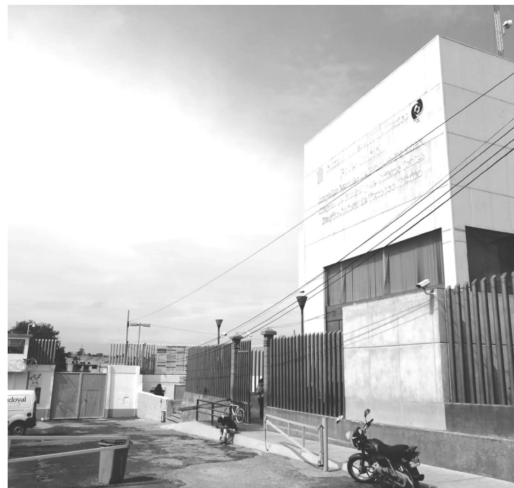
▲ Las autoridades iniciaron las investigaciones en la cárcel.

En ambos casos, se inició una denuncia de hechos ante la agencia del Ministerio Público de Texcoco para realizar las investigaciones pertinentes que permitan identificar a los probables responsables.