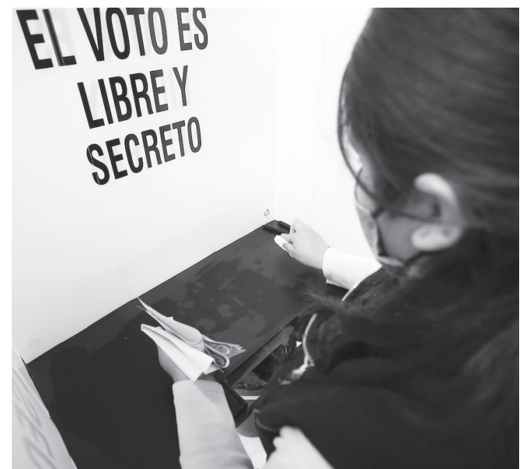
▲ La veda inició tres días antes de las elecciones y no permitía actos políticos.

“Se impondrá de mil a cinco mil días multa y de cinco a quince años de prisión al que por sí o por interpósita persona realice, destine, utilice o reciba aportaciones de dinero o en especie a favor de algún precandidato, candidato, partido político, coalición o agrupación política cuando exista una prohibición legal para ello, o cuando los fondos o bienes tengan un origen ilícito, o en montos que rebasen los permitidos por la ley”.