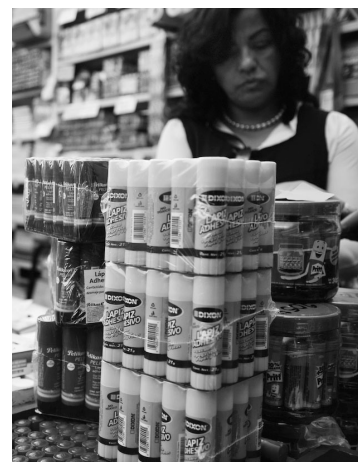
▲ Las papelerías podrían verse beneficiadas.

Confirió en que el regreso será de forma segura, lo cual permi-