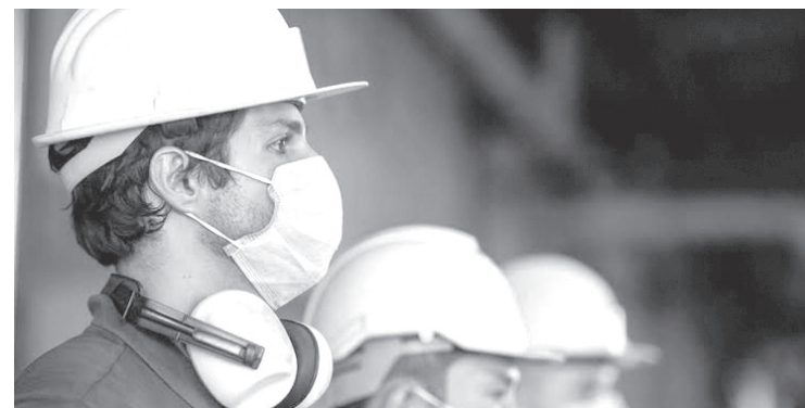
▲ La vacunación ha avanzado y eso ha acelerado el retorno a la normalidad..

"No nada más hicimos gira para ir apoyarlos y ayudarlos en las campañas, sino en las propias giras se les decía que vamos a llegar a exigirles que sean muy buenas autoridades municipales, y no sólo por la ciudadanía, sino por ellos mismos", expresó.