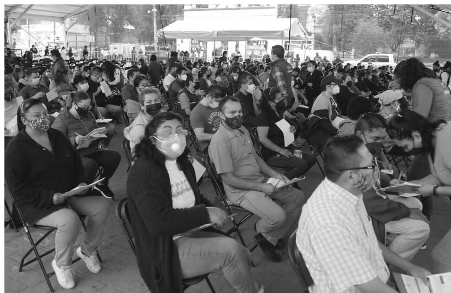
▲ Las personas debieron registrarse en internet.

De estos municipios, el que tiene menor población es Papalotla, donde las autoridades prevén vacunar a 670 personas.