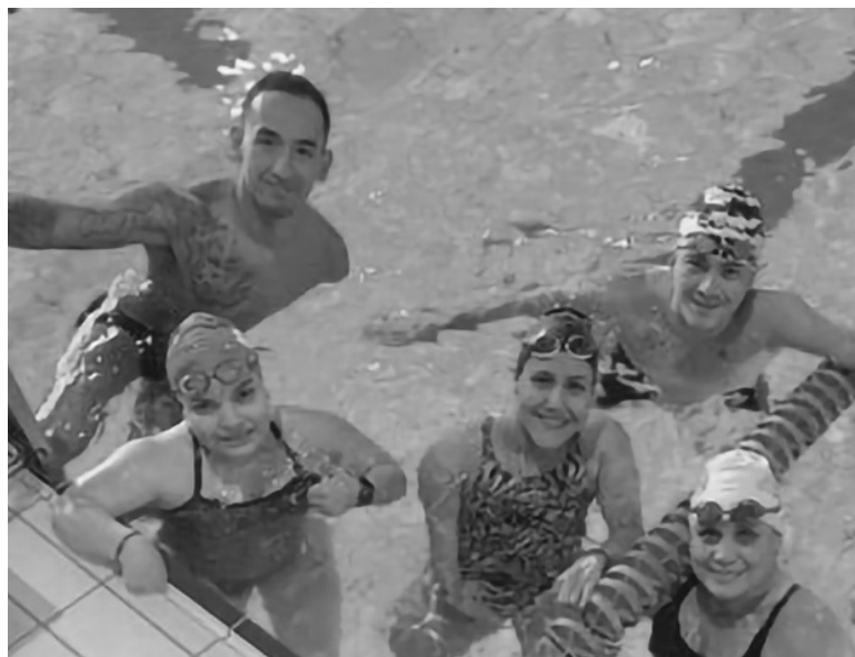
▲ Los nadadores mexiquenses viajaron a Alemania.

Pero ello, no detiene sus calendarizaciones, los y las nadadoras mexiquenses tendrán actividad en julio y agosto con competencias nacionales en Morelos y en Acapulco, Guerrero, independientemente de lo que suceda con la máxima justa deportiva nacional.