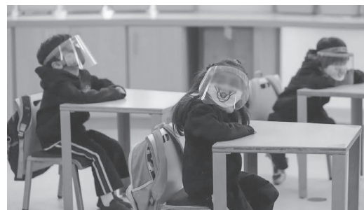
◀ Sólo 250 mil alumnos regresaron a clases presenciales, de un universo de 4.5 millones. Foto Especial