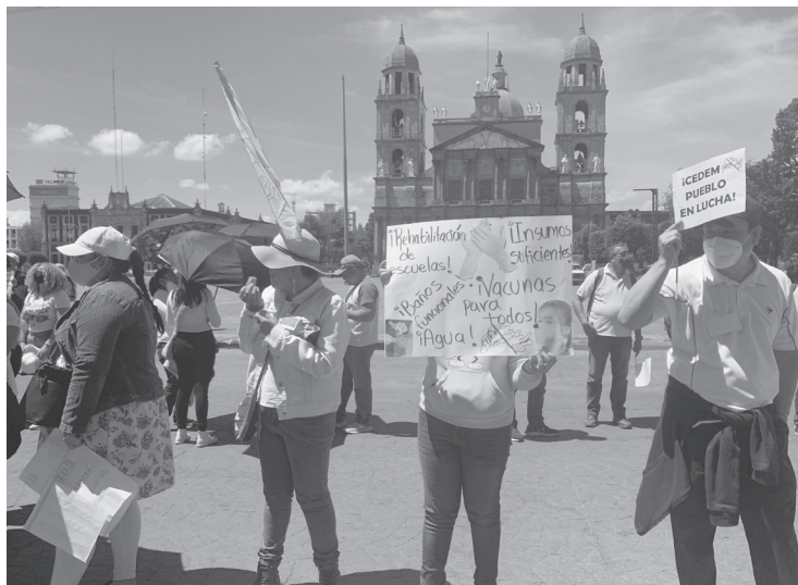
▲ Los maestros se apostaron frente a palacio de Gobierno con el propósito de entrevistarse con el titular de Educación, pero no los recibió.

“Si bien nosotros como maestros ya fuimos vacunados, nuestras familias no, hay adultos en casa que no han sido vacunados, niños, y están expuestos a que llevemos el virus... lo mismo pasa con los niños en las escuelas, hay muchos asintomáticos, pero también ya hemos conocido casos de niños que van a parar al hospital por el virus y aunque no se enferman de gravedad, es exponerlos