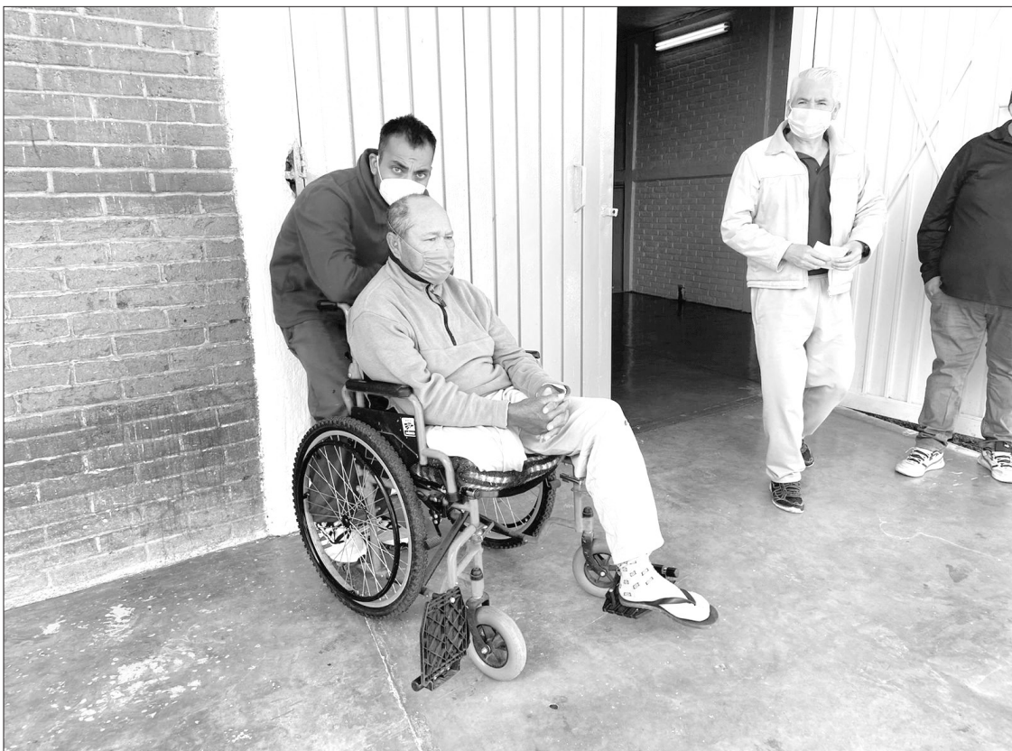
▲ Esta jornada de inmunización tuvo el respaldo de la Guardia Nacional.