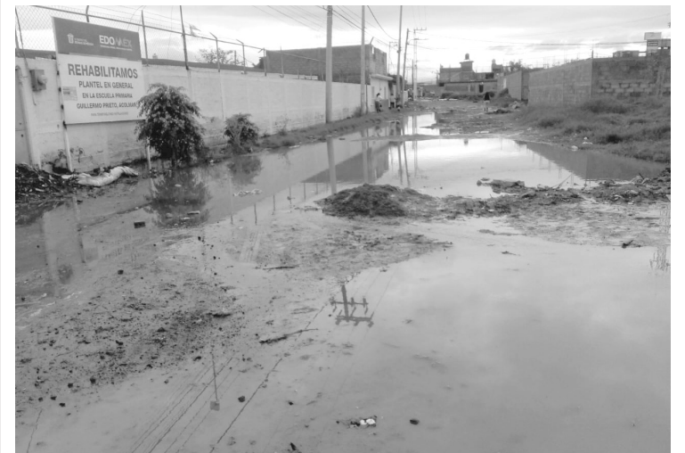
▲ El encharcamiento impidió el regreso a clases presenciales.

Por dicho cauce se desalojan las aguas tratadas de la Termoeléctrica hacia los ejidos del municipio vecino de San Salvador Atenco.