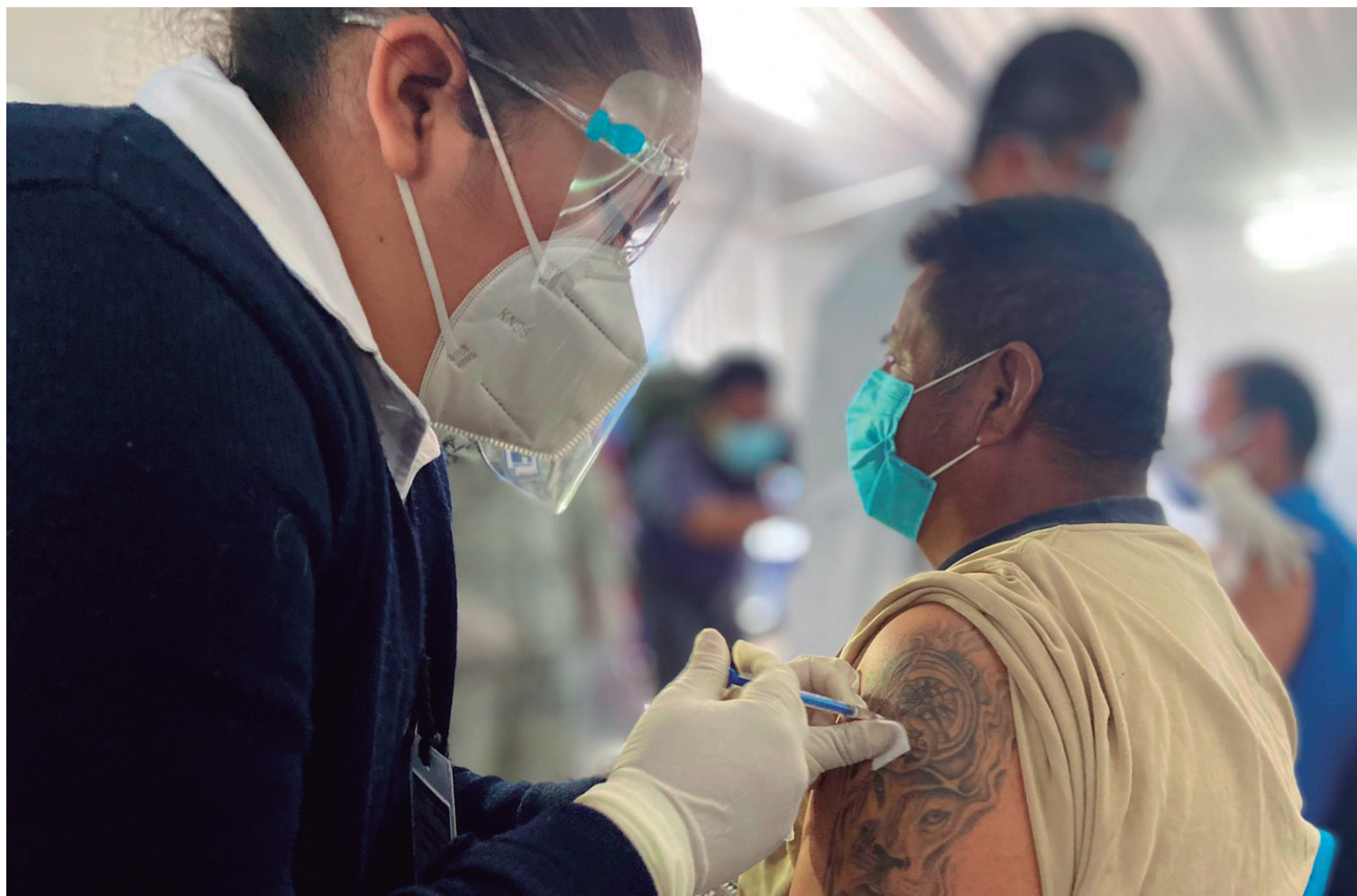
▲ Las personas privadas de su libertad ubicadas en el Penal de Almoloya fueron inmunizadas ayer contra el Covid-19.