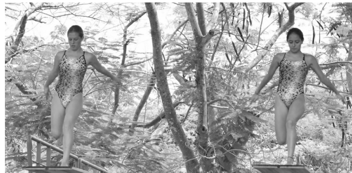
◀ Las nadadoras mexiquenses tendrán actividad en julio y agosto.

Las acciones comenzarán hoy en la piscina del Schwimm- und Sprunghalle en el Europasportpark (SSE), considerada una de las más rápidas del mundo.