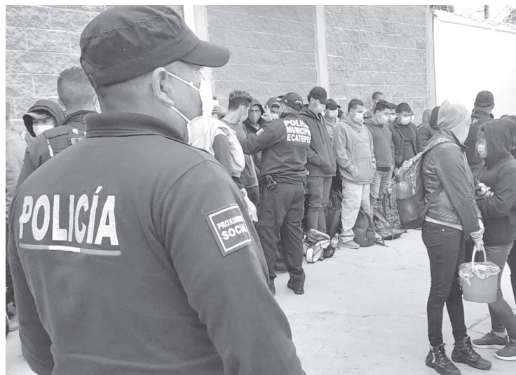
▲ Los centroamericanos fueron conducidos a la casa de pernocta "Petra Herrera", donde recibirán alimentos y atención médica.

De acuerdo con la autoridad, uno de los detenidos afirmó que recibió 3 mil 500 pesos semanales por transportar a estas personas; otro de los asegurados declaró que junto con su hijo recibió dos mil pesos por resguardarlos y alimentarlos.