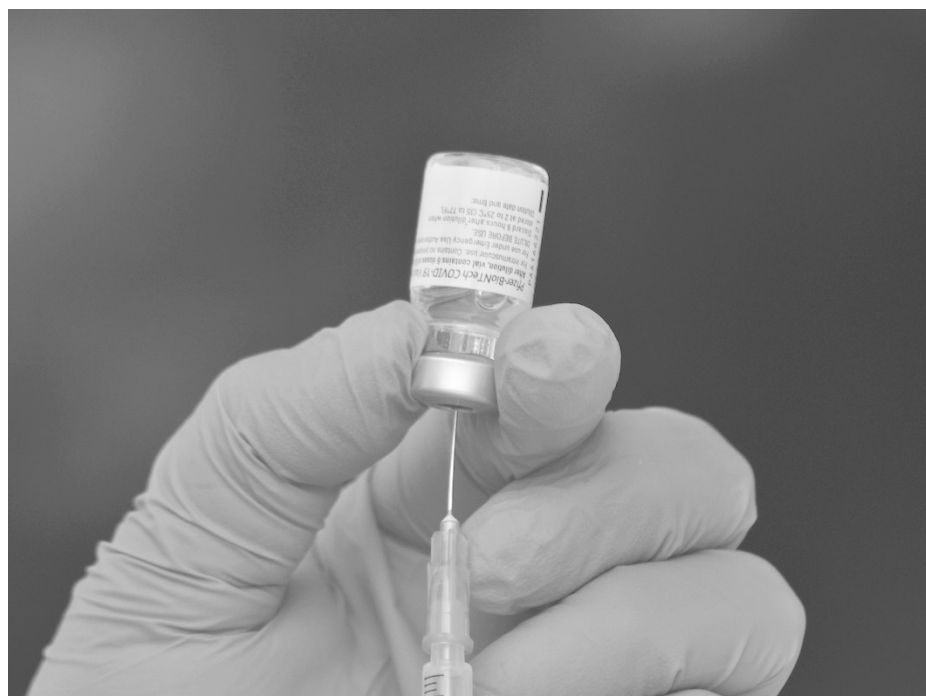
▲ La dosis aplicada es de la farmacéutica Pfizer.

Finalmente exhortaron a la población a continuar con las medidas sanitarias preventivas, aunque ya hayan sido vacunados, como son el correcto uso de cubrebocas, caretas y/o goggles, lavado frecuente de manos y mantener la sana distancia.