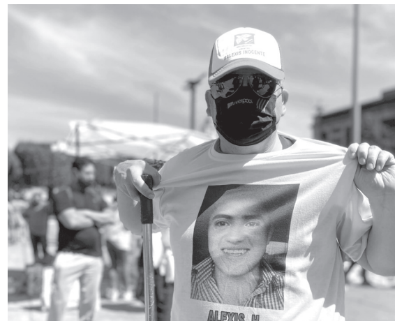
◀ Los familiares de los internos podrán realizar su trámite directamente en la nueva plataforma.

Llamó al árbitro electoral federal a cumplir con la organización de la consulta al valorar que le falta difusión.