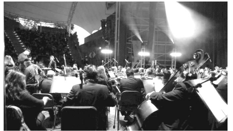
▲ Solo participarán 45 integrantes por cuestiones de sanidad.