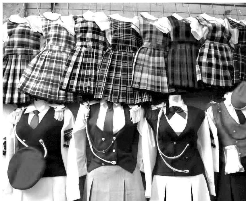
▲ El costo de las prendas aumentó por el incremento en los insumos.

Santaella destacó que los indicadores del 90 por ciento están en el rango de 12 hasta 34 años. Los de 35 a 44 bajan un poco a 78.5, pero el 68 por ciento de las personas de 6 a 11 años es usuaria y es prácticamente el mismo porcentaje de los de 45 a 54 años.