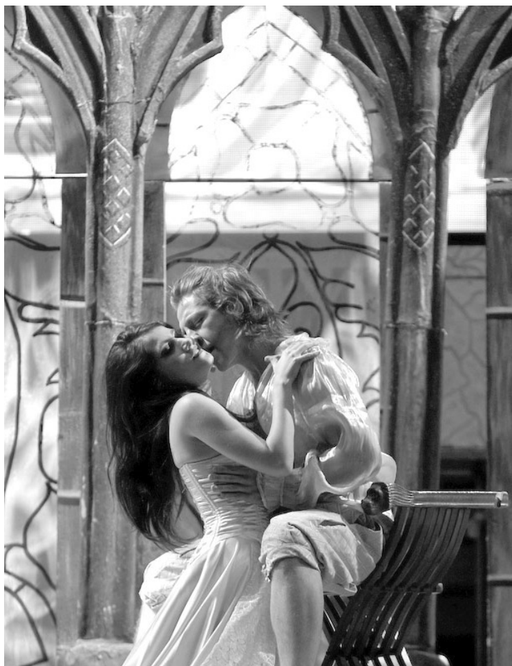
▲ Fue el primer canal dedicado a las artes y la cultura nacional.