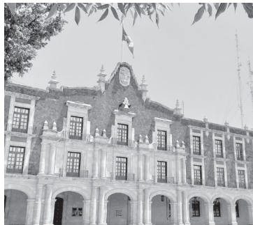
▲ La Comisión de Vigilancia del Órgano Superior de Fiscalización sesionó en la Legislatura local.

Lo anterior se dio a conocer durante la tercera sesión de trabajo, al seno de la Comisión de Vigilancia