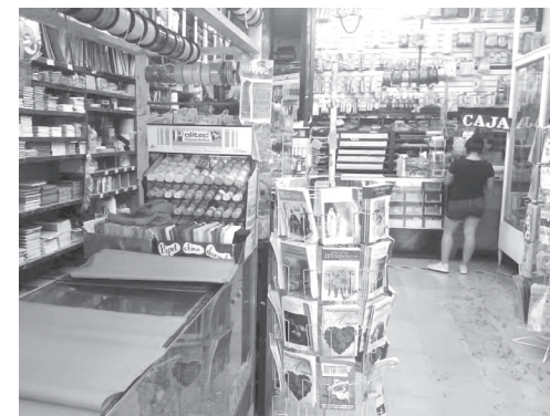
◀ La pandemia hizo que al menos 35 por ciento de este tipo de negocios tuviera que cerrar.

Consideró es necesario que las autoridades tomen cartas en el asunto y, de ser necesario, declaren nuevamente semáforo amarillo para evitar más contagios, pero el llamado principal lo hizo a la ciudadanía para que mantenga los cuidados y reduzca los niveles de contagios.