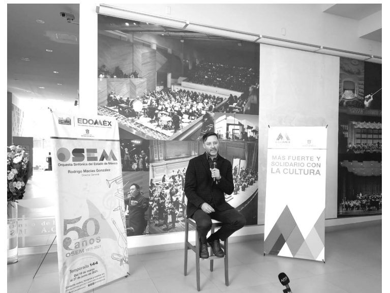
▲ El festival es parte de los 50 años de la OSEM.

"Yesterday", "Come together", "Hey Jude", "Strawberry fields forever" y "Here comes the sun" serán algunos de los temas que tocarán