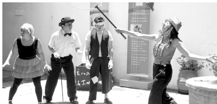
▲ Uno de sus objetivos es difundir el arte.

De acuerdo con el informe Digital News Report 2021, hecho por el Reuters Institute de la Universidad de Oxford