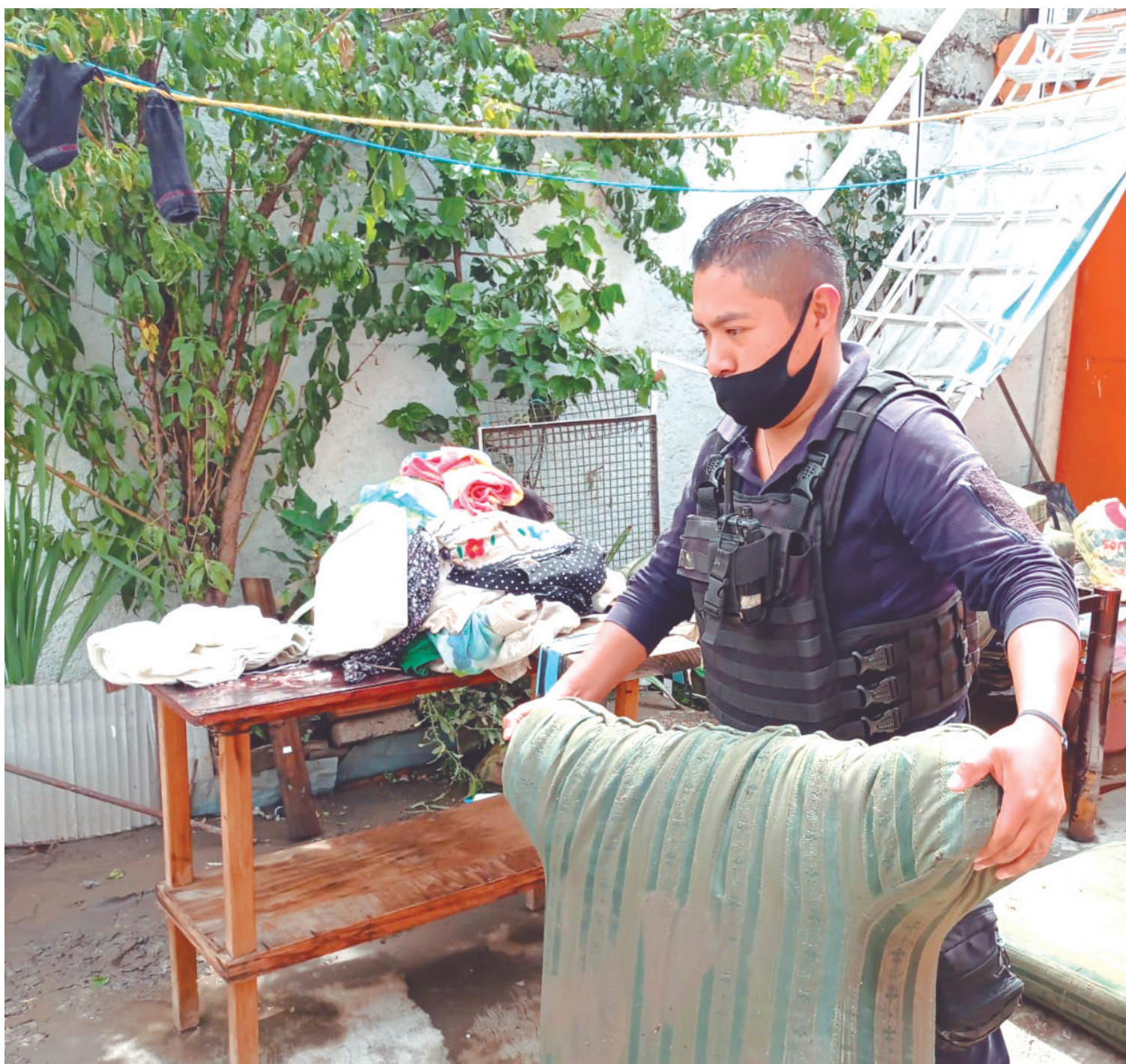
▲ Elementos de Protección Civil auxiliaron a la población para tratar de salvar algunos de sus muebles. También acudieron brigadas de salud para vacunar y desparasitar.