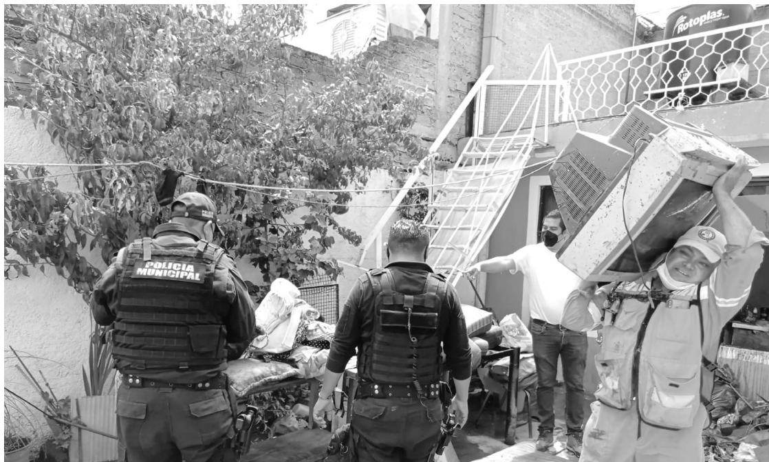
▲ Aparatos electrónicos, muebles y ropa quedaron inservibles en decenas de casas de Atizapán.

La Comisión del Agua del Estado de México informó en un comunicado que se registraron 200 viviendas afectadas en los