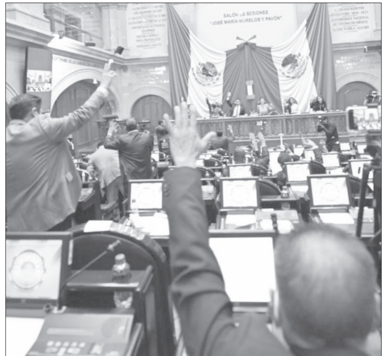
▲ La Junta de Coordinación considera prioridades y necesidades de la entidad.

El delito se perseguirá de oficio y destaca que el Estado de México es un referente nacional en desarrollo económico.