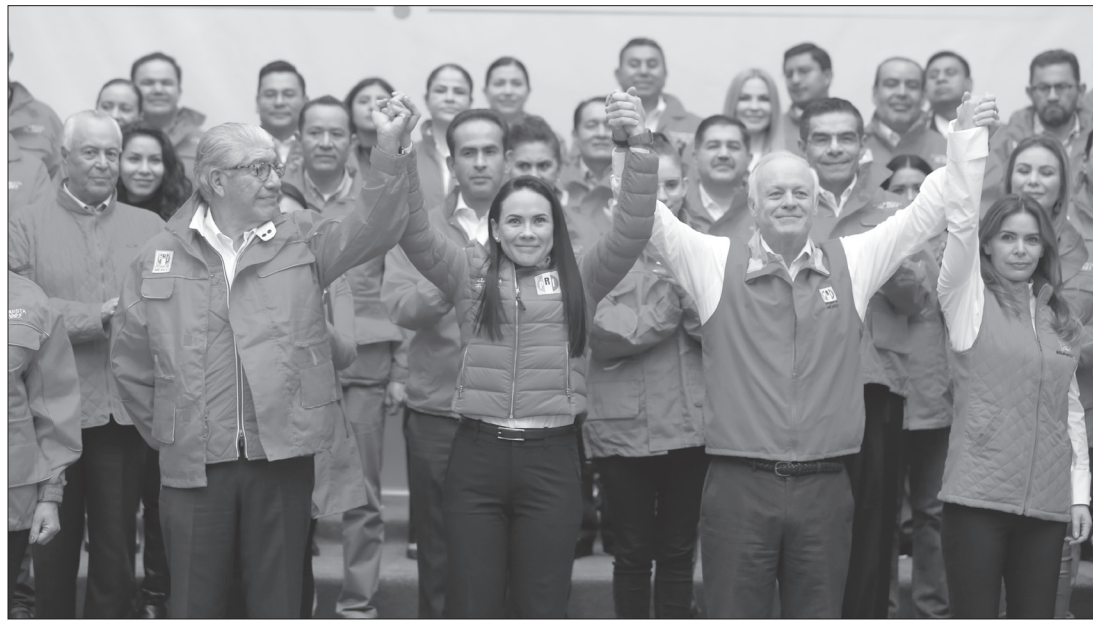
▲ Lanza el PRI 11 coordinaciones regionales para la Defensa del Edomex.