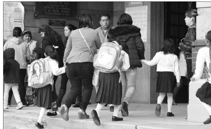
▲ Autoridades recomiendan el uso de ropa adicional al uniforme. Foto especial

Por último, subrayan la importancia de vacunarse contra la in-