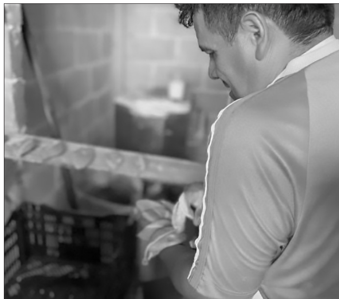
▲ Participan más de 100 maestros panaderos. Foto especial

Melitón Ibarra mencionó que también habrá otras actividades culturales como charrería, baile, chinelos y danzas prehispánicas.