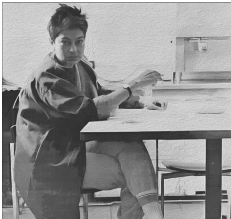
▲ Gayatri Chakravorty Spivak, escritora de la India.

Gayatri Spivak es una referente mundial, feminista, marxista, desconstruccionista, poscolonial. Nació en Calcuta en 1942 y en la India hizo sus primeros estudios universitarios. Al inicio de los años setenta se doctoró en Estados Unidos con una tesis dedicada a la vida y poesía de W.B. Yeats, bajo la dirección de Paul de Man. Además, tradujo al inglés a Jacques Derrida, filósofo que influyó de manera decisiva en su activismo. En 1983,