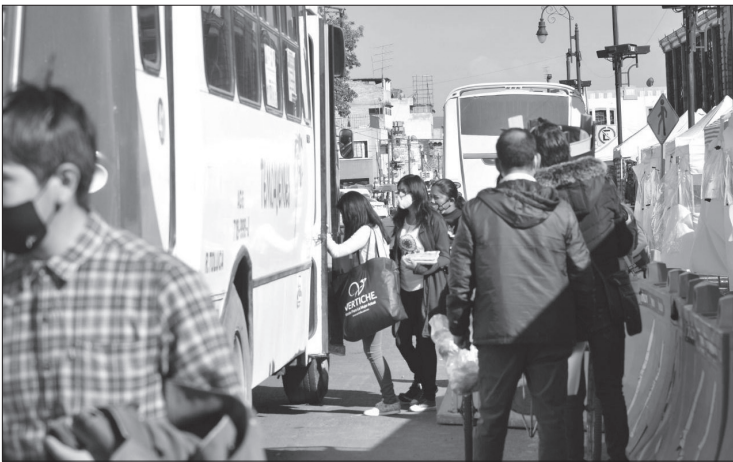
▲ El movimiento "no al Tarifazo" pide que la Legislatura autorice los aumentos a las tarifas. Foto especial

"Mientras las aspirantes pretenden convencernos de votar por